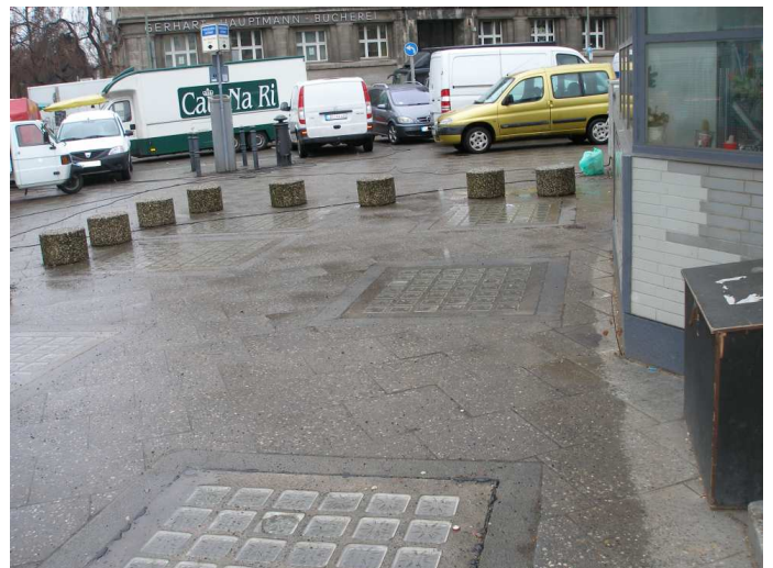
Foto: Hinter dem Pavillon. Hier soll ein Café entstehen. Die Glassteinflächen befinden sich direkt über der Toilettenanlage und sorgen tagsüber für ausreichend Licht.

Ich habe diese Pläne zum Anlass genommen, mir den unterirdischen Bereich einmal anzuschauen und auch die direkten Anrainer des Platzes und der näheren Umgebung zu besuchen. Foto links: Einer der beiden Seitenzugänge zum Toilettenbereich, aus dem eine Kultur-einrichtung werden soll.