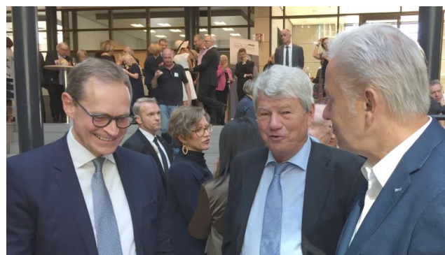
Foto: Beim Empfang nach der Veranstaltung, der Regierende Bürgermeister Michael Müller im Gespräch mit dem früheren Berliner Justizsenator Wolfgang Wieland und Klaus Wowereit.

Ernst Reuter war ein unerschrockener Wegbereiter der Demokratie in Deutschland. Er hat die Freiheit gesucht, sie lieben gelernt und für sie gekämpft. Sein Mut und seine Liebe zur Freiheit – sie bleiben unvergessen, sie bleiben uns Vorbild und Ansporn.“