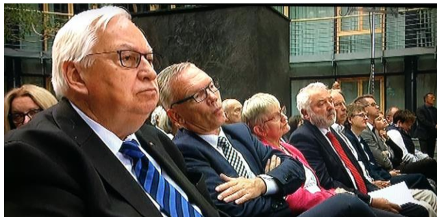
Foto: Aufmerksame Zuhörer bei der Rede des Bundespräsidenten.

Und es war kein Zufall, dass Ernst Reuter zeit seines Lebens ein leidenschaftlicher Kommunalpolitiker war. Für ihn war die kommunale Selbstverwaltung Basis und Schule der Demokratie. Die Voraussetzung für Selbstbestimmung aber heißt Freiheit. Zwang pervertiert jedes Ideal zur Unkenntlichkeit – das war die eindrücklichste und nachhaltigste seiner Lebenslektionen.