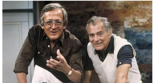
Dreamteam des deutschen Kabarett, Dieter Hildebrandt und Sammy Drechsel.

ich keinen Auftritt. Anschließend wollte ich noch zum Europa-Center gehen, um mit einem Freund etwas zu trinken. Im Europa-Center, das Anfang April 1965 eingeweiht wurde und in das die „Stachelschweine“ von der Rankestraße umgezogen waren, trafen wir auf Dieter Hildebrandt, der die neue Spielstätte des Berliner Kabarett suchte. Bei dieser Suche half ich ihm und bei den Stachelschweinen tranken wir dann mit Wolfgang Gruner noch eine Cola.